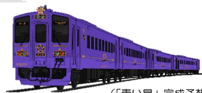
（「青い星」完成予想図）

※ 具体的な運転時刻および運転日、車内サービスや駅での「おもてなし」、料金、また販売方法などについては、決まり次第お知らせします。