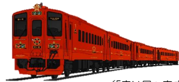
（「赤い星」完成予想図）